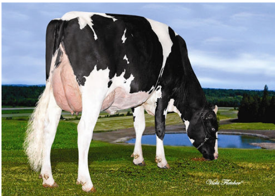
EDITORIAL DANE STOVIA