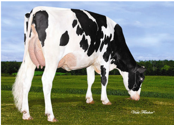
VALPAU DANE DANSY