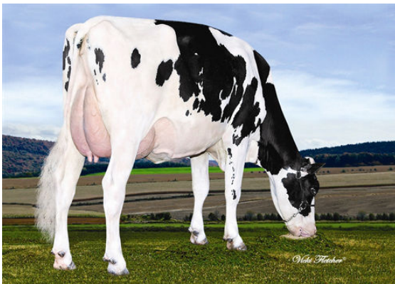
LINDENOORD DANE TORRENT